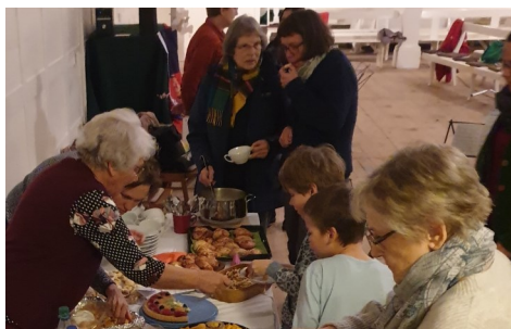
Weltgebetstag aus Taiwan