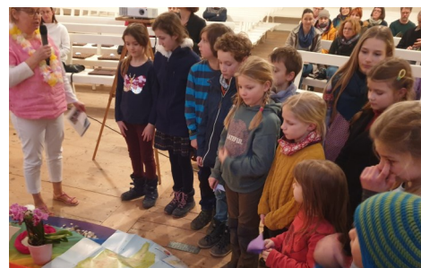
Weltgebetstag aus Taiwan