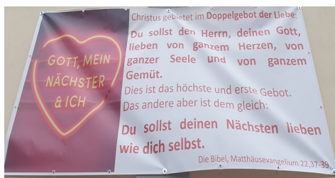
Banner an unserer Kirche